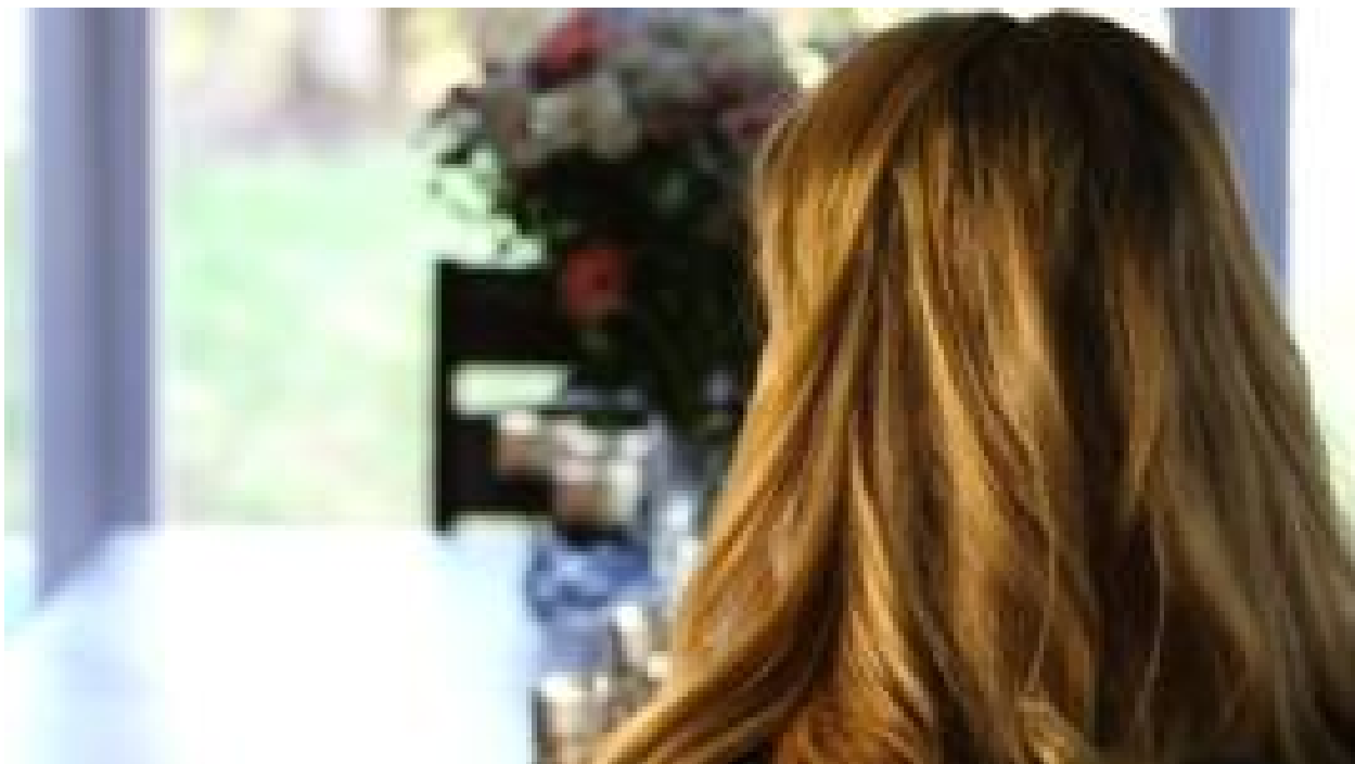
'به همه آنها تجاوز کن تا ادبشان کنی'