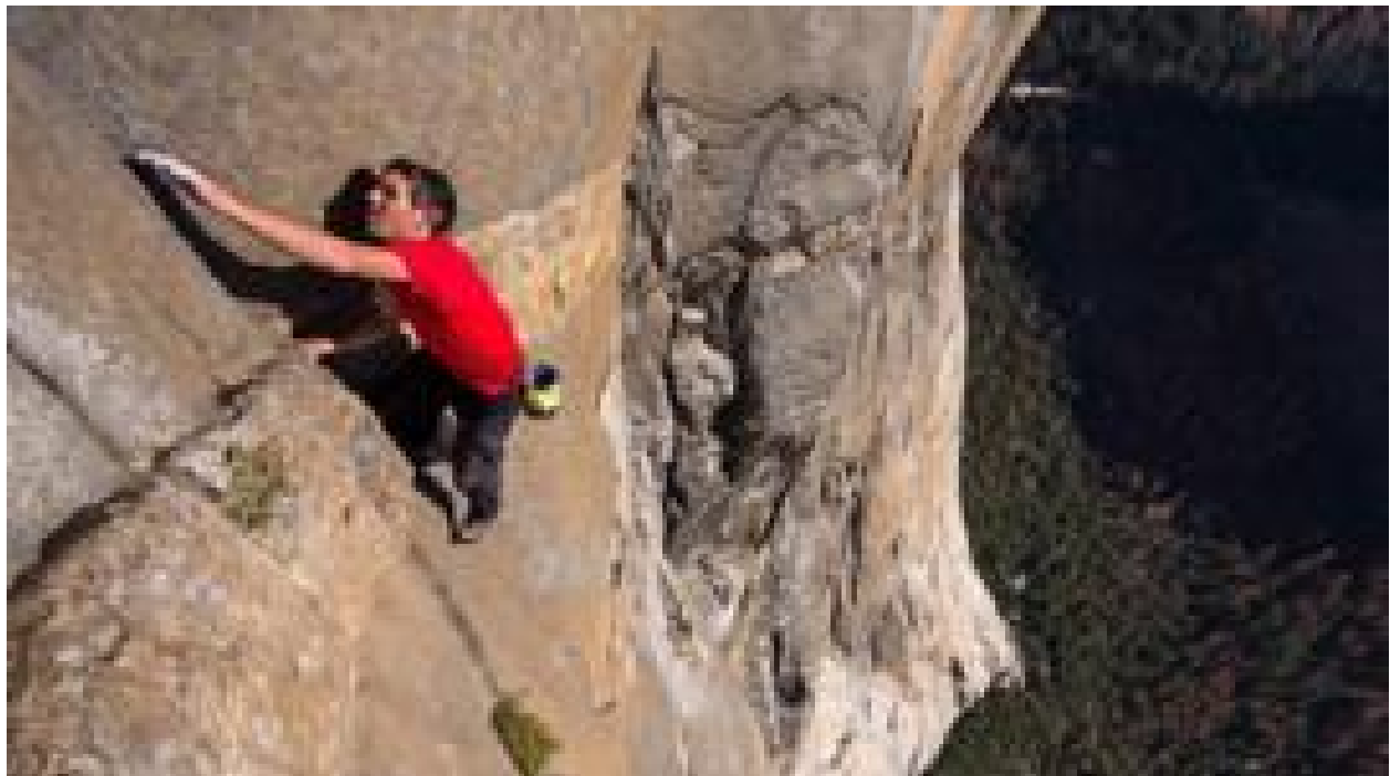
چطور بر ترس غلبه کنیم