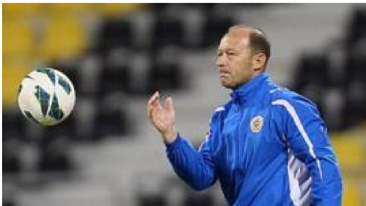
پرسپولیس آرژانتینی و حفاظت از میراث برانکو