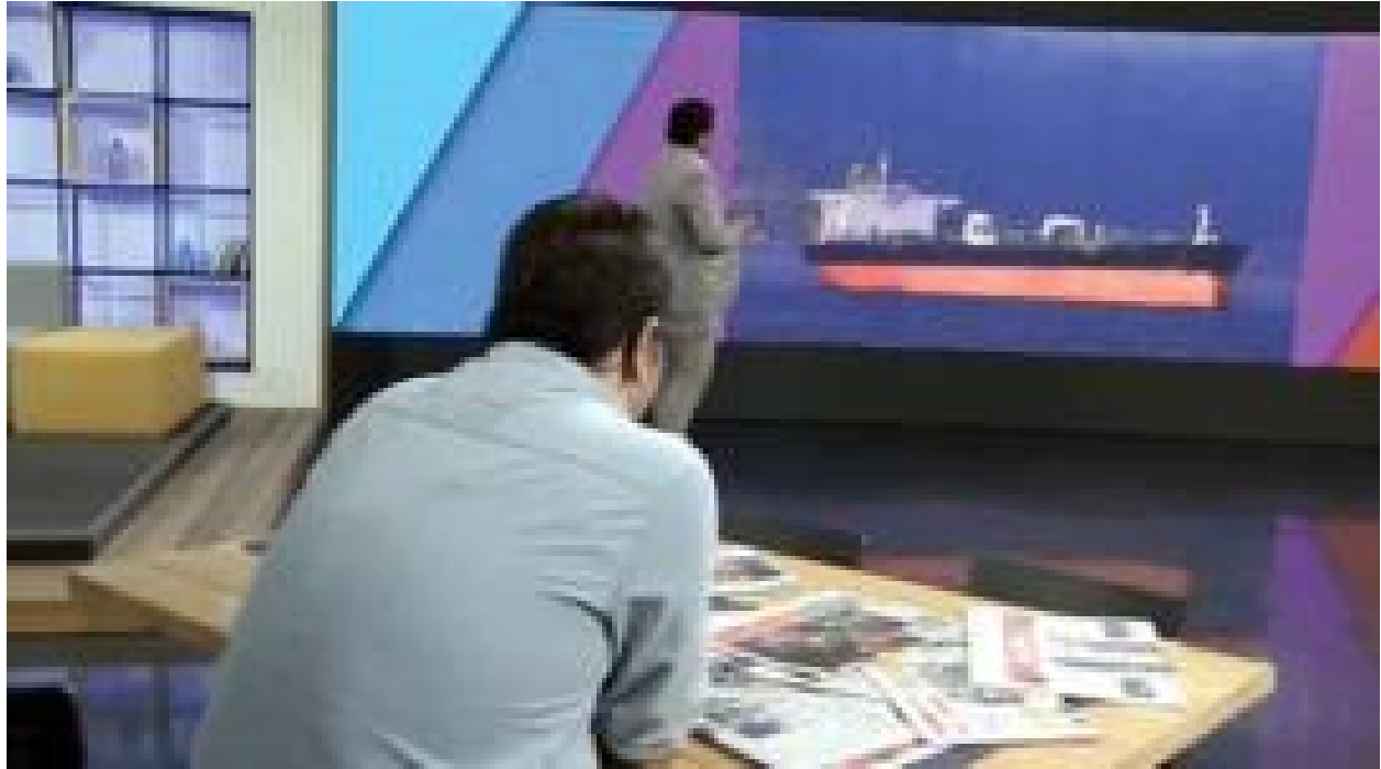
آیا صدا و سیما سیاست دور زدن تحریم نفتی دولت روحانی را لو داد؟