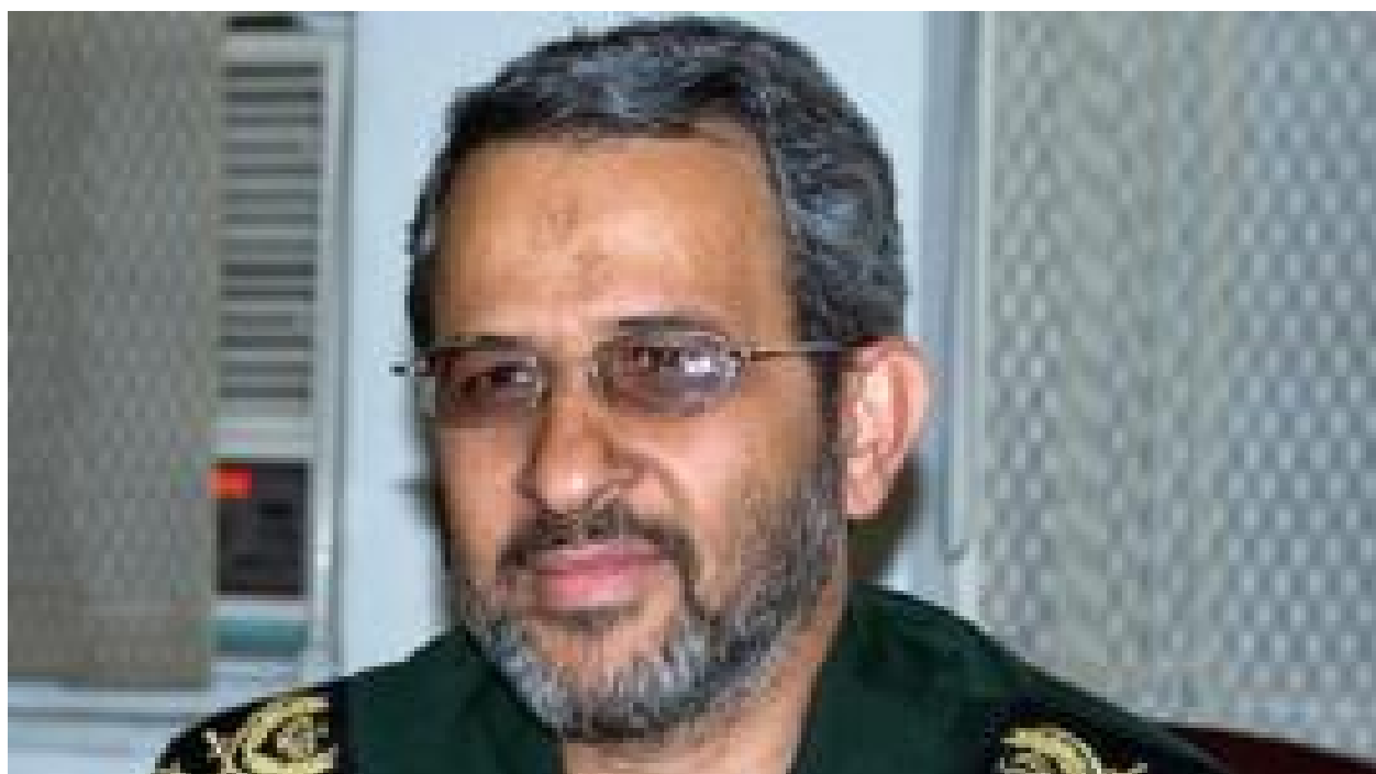
چرا رئیس بسیج تغییر کرد؟