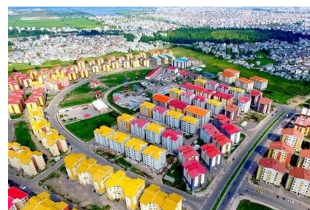
شهرکی اروپایی شبیه به بارسلون در دل گیلان! + تصاویر