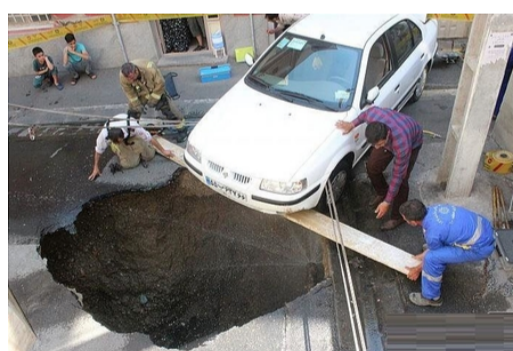
کوچه دهان باز کرد و سمند را بلعید! + تصاویر