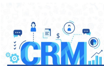
چرا به نرم افزار CRM نیاز داریم؟