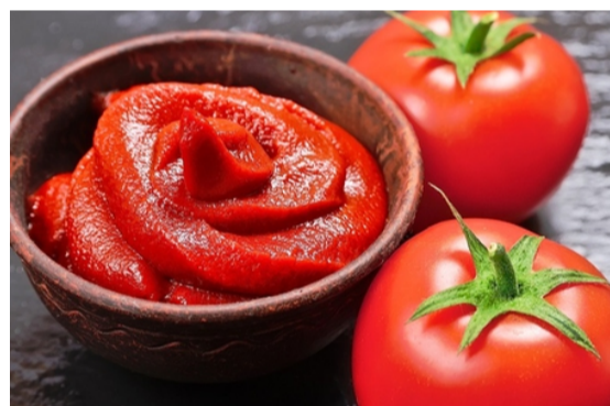
بهترین طرز تهیه رب گوجه با دستور مادر بزرگ‌ها