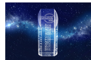
بهترین بانک ایران کدام است