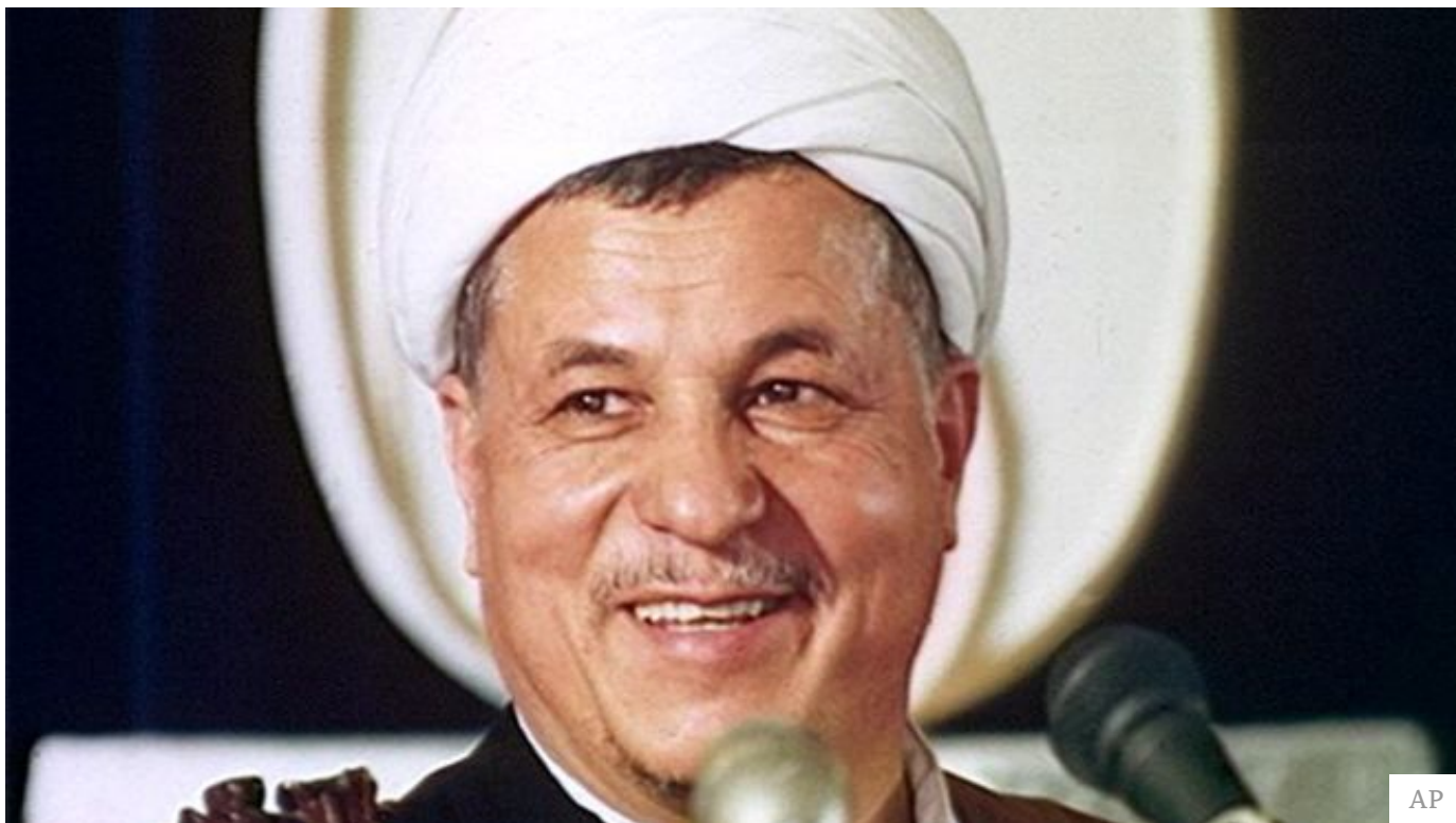
آقای رفسنجانی در اولین دوره ریاست‌جمهوری بعد از مرگ آیت‌الله خمینی