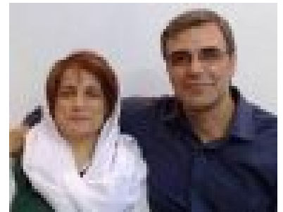
https://persian.iranhumanrights.org/1397/07/mohammad محمد حسین آقاسی: کیفرخواست پنج نفر از هشت فعال محیط زیست صادر شده است؛ آنها نیاز به وکیل دارند (/hossein-aghasithe-issuance-for-five-environmental-activists)