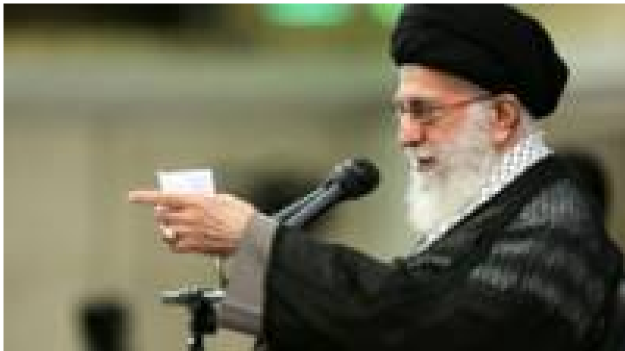
رهبر ایران تایید کرد که مخالف نامزدی احمدی نژاد در انتخابات است