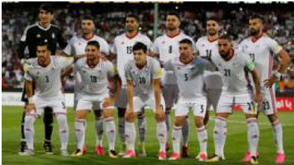
جام جهانی ۲۰۱۸ روسیه؛ نمایه تیم ایران