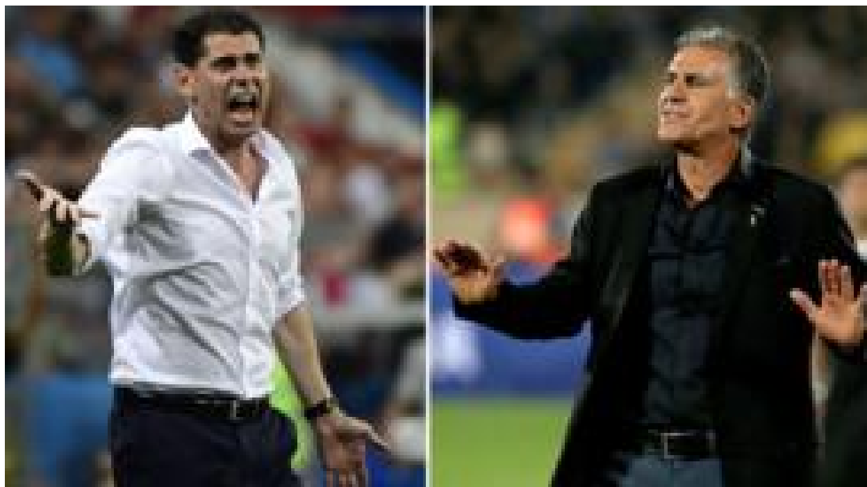
چطور باید مقابل اسپانیا بازی کرد؟