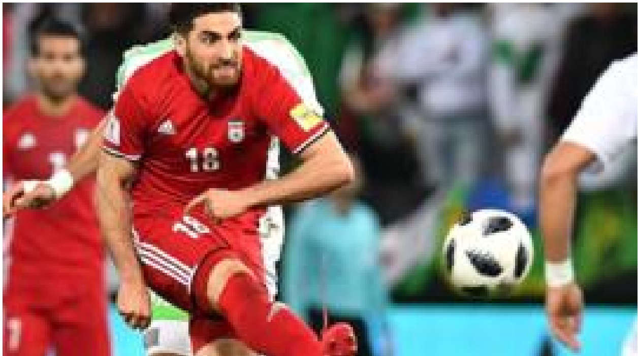
ایران در چه صورتی به مرحله بعدی جام جهانی صعود خواهد کرد؟ #ازمابپرس