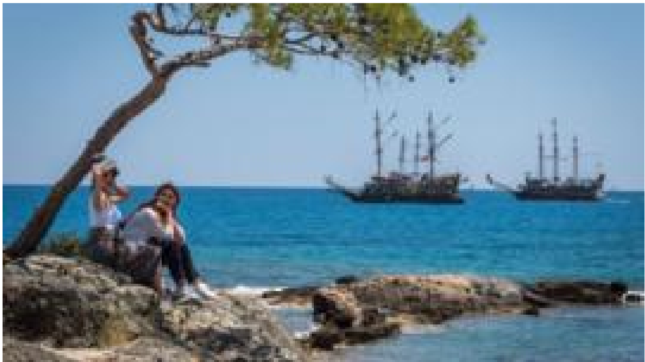
سهم مسافرت‌های خارجی ایرانی‌ها از بازار ارز چقدر است؟