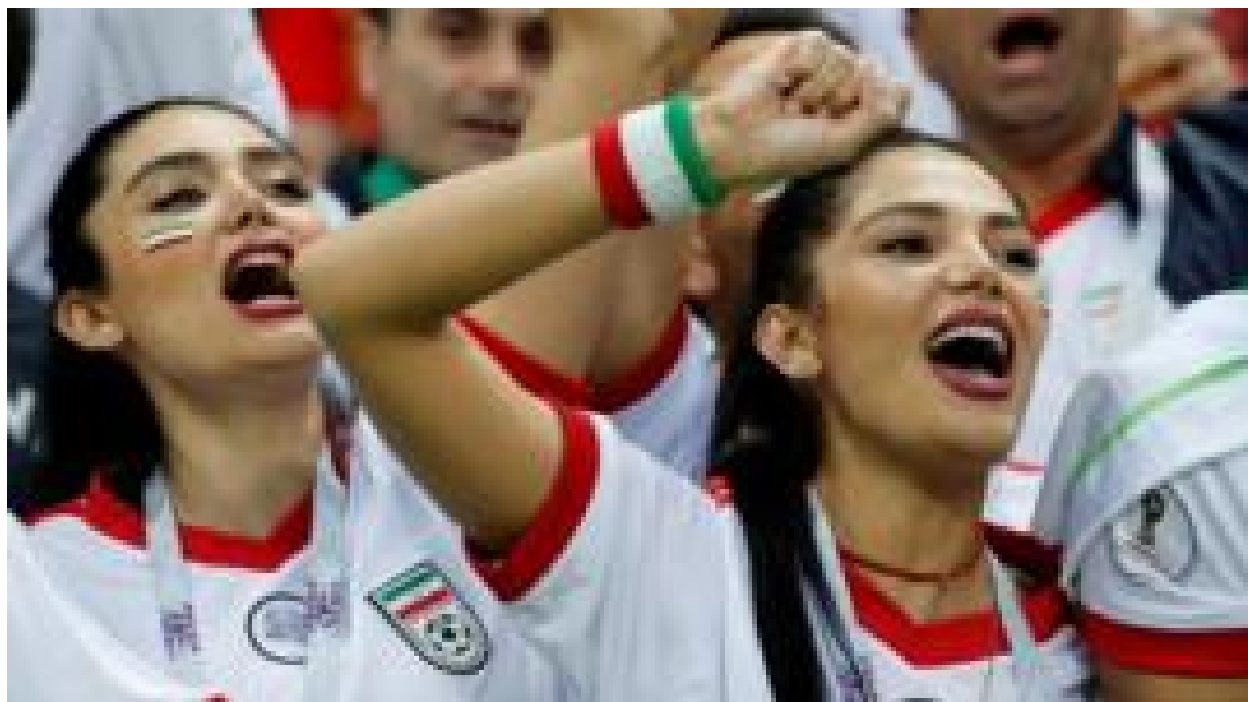
جام جهانی روسیه؛ چطور تیم ملی ایران جهانی شد؟