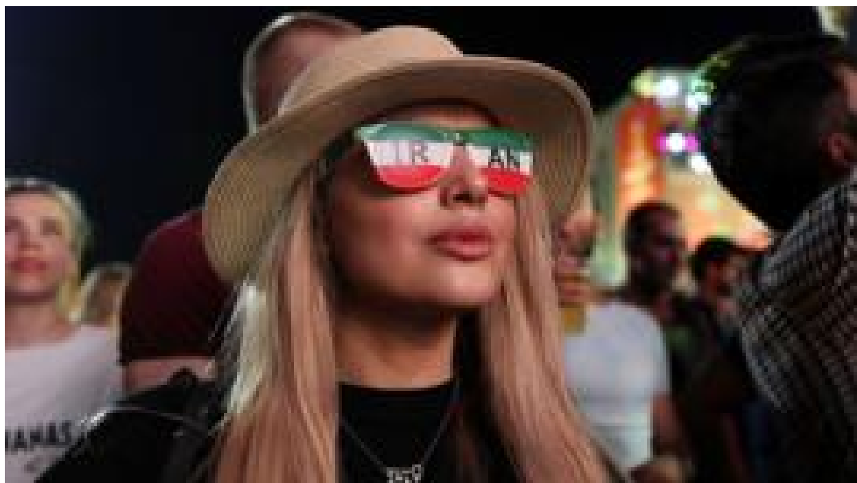
بی‌خوابی رونالدو در سارانسک