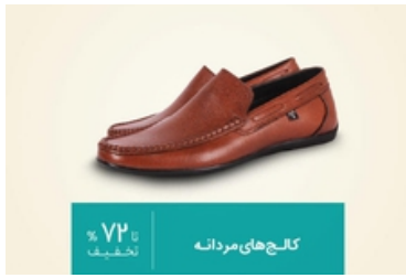
محصولات پرفروش بامیلو حراج شد!!