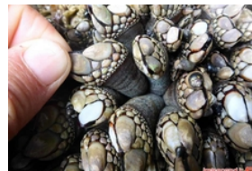
خطرناک ترین غذاهای دنیا