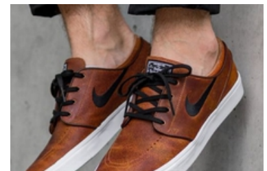
محصولات پرفروش بامیلو حراج شد!!