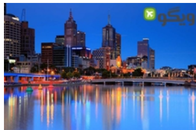
اقامت در تفلیس از شبی ۲۱ هزار تومان