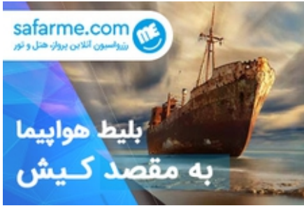
سفری رویایی به کیش با بهترین قیمت بازار

تا ۵۶% تخفیف برای عطرهاى پرفردار در دیجی کالا