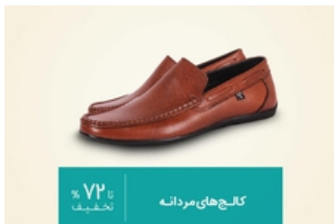
محصولات پرفروش بامیلو حراج شد!!