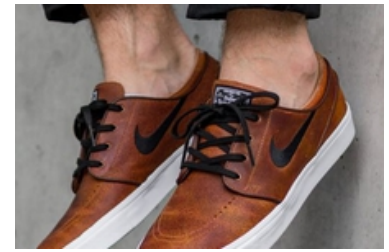
محصولات پرفروش بامیلو حراج شد!!

تا ۵۶% تخفیف برای عطرهاى پرفردار در دیجی کالا