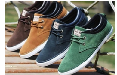
محصولات پرفروش بامیلو حراج شد!!