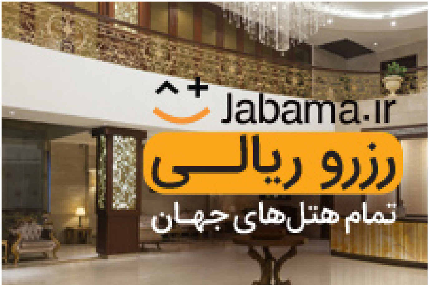
رزرو آنی تمام هتل‌های استانبول با پرداخت ریالی

( https://jabama.ir/hotels/?utm_source=Display&utm_medium=Hamshahri&utm_campaign=JB97H1&utm_content=Native )