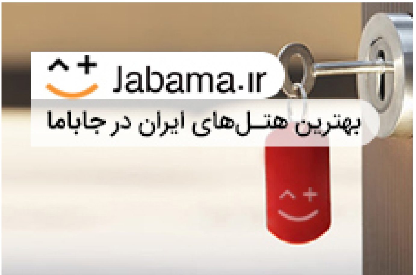
رزرو هتل‌های مشهد با بهترین قیمت از سایت جاباما

( https://jabama.ir/hotels/?utm_source=Display&utm_medium=Hamshahri&utm_campaign=JB97H1&utm_content=Native )