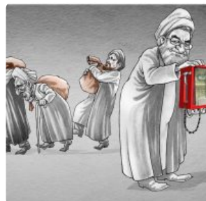
کارتون؛ سهم مردم، سهم نهادهای مذهبی