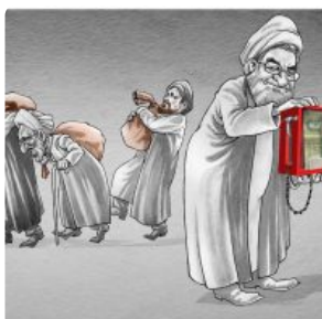
کارتون؛ سهم مردم، سهم نهادهای مذهبی