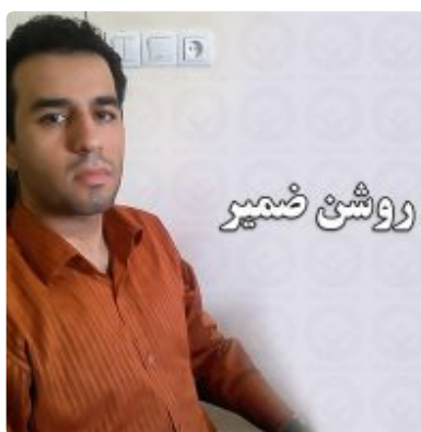
بانک زندانیان سیاسی پیمان روشن ضمیر

امروز شنبه ۱۵ بهمن ۱۳۹۰, 24th of June 2018 آخرین بروز رسانی در ۱۳۹۰/۱۱/۱۵ ساعت ۲۲:۳۷:۵۷