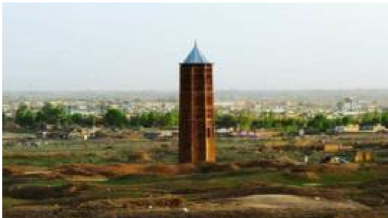
جنگال غزنی؛ راه حل دولت برای توازن نمایندگی پشتون ها و هزاره ها در انتخابات؟