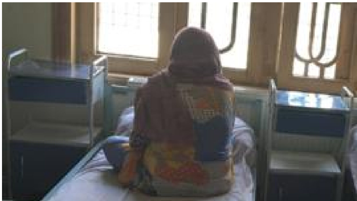
ناگزیری های عروس تریاک پس از ترک اعتیاد