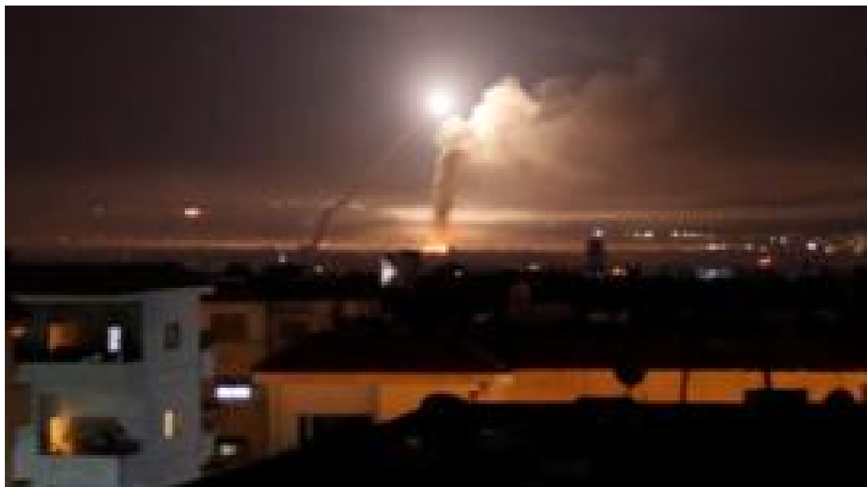
ایران، سوریه و منطق ادامه حضور