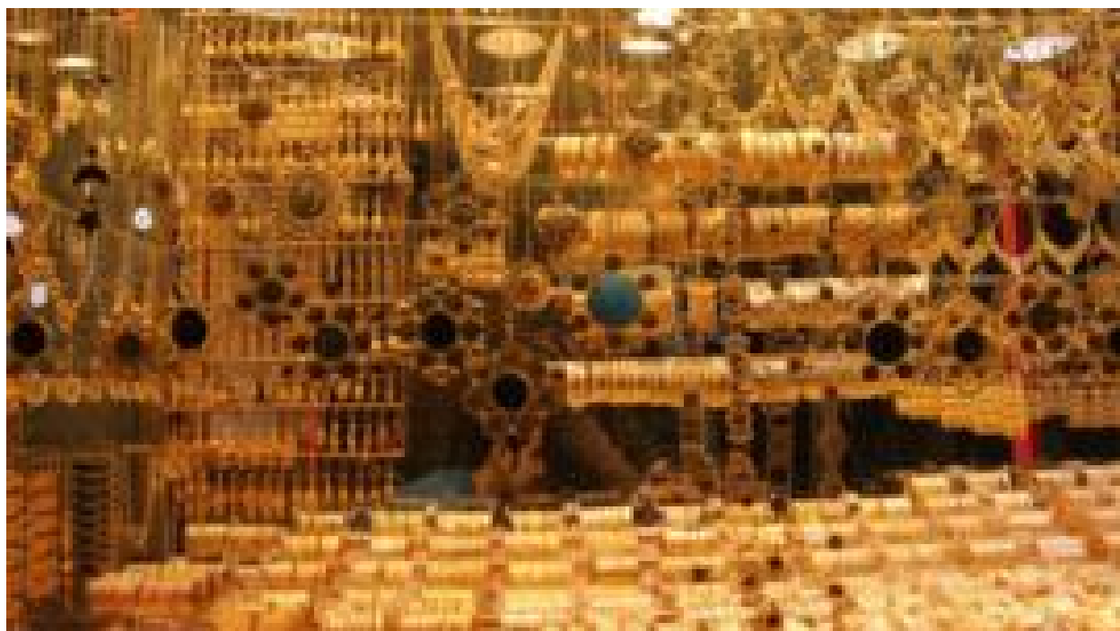
'طلای خود را به دولت می دهیم' یا نه؟