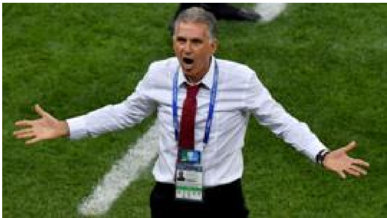
غولی که دست و پایش بسته بود