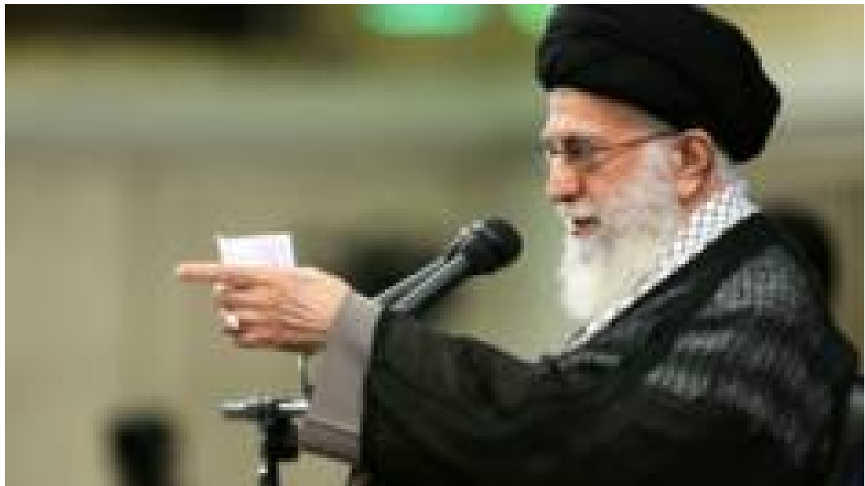
رهبر ایران تایید کرد که مخالف نامزدی احمدی نژاد در انتخابات است