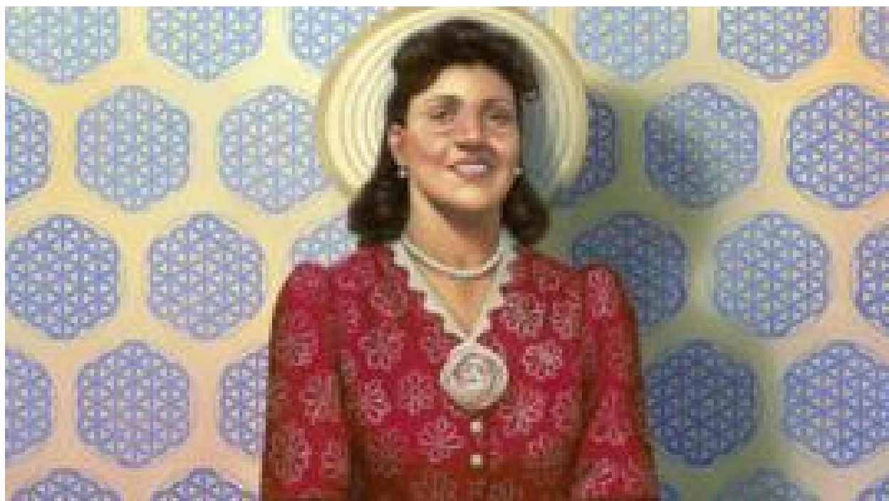
ادامه زندگی سلولی هنریتا لکس دهه ها بعد از مرگش