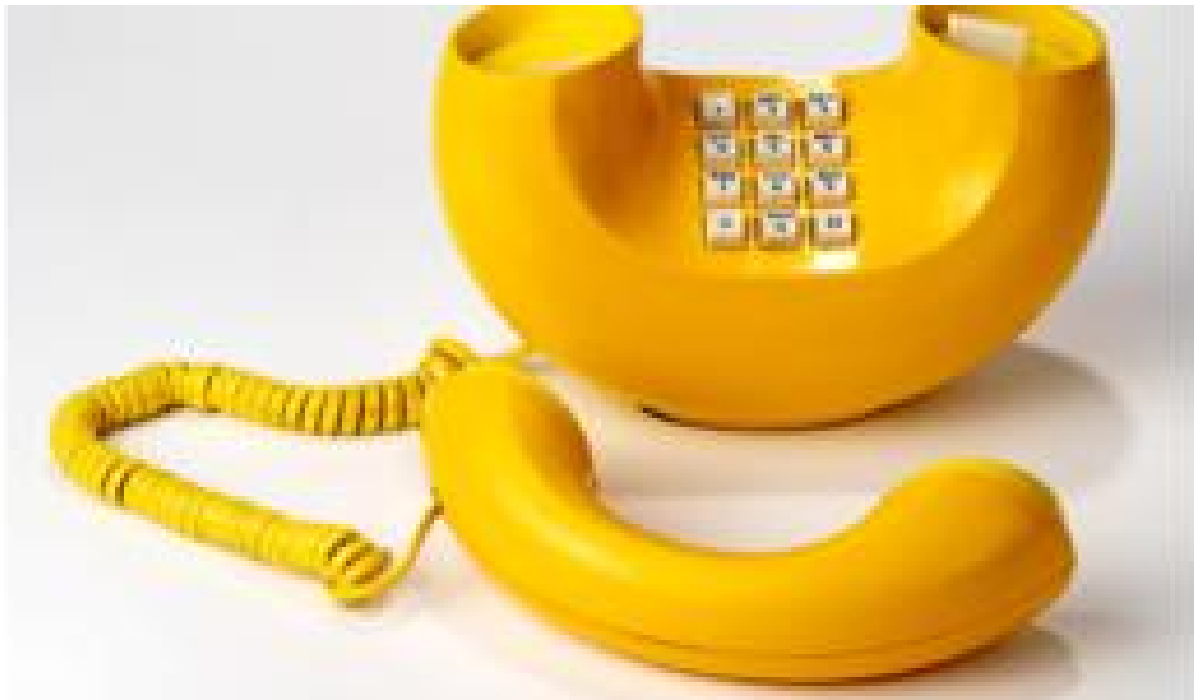
۸ دلیل علاقه ما به پلاستیک