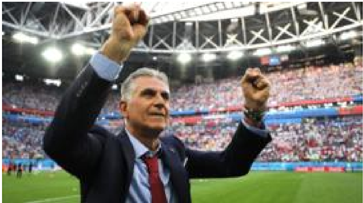
کی‌روش در مصاحبه اختصاصی با بی‌بی‌سی: باید ۱۶ بازیکن به زمین بفرستم