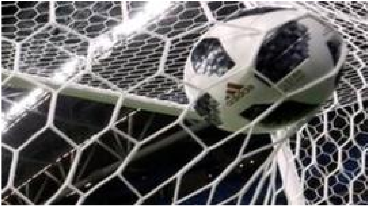
تحلیل بازی ایران و اسپانیا: باخت روحیه بخش