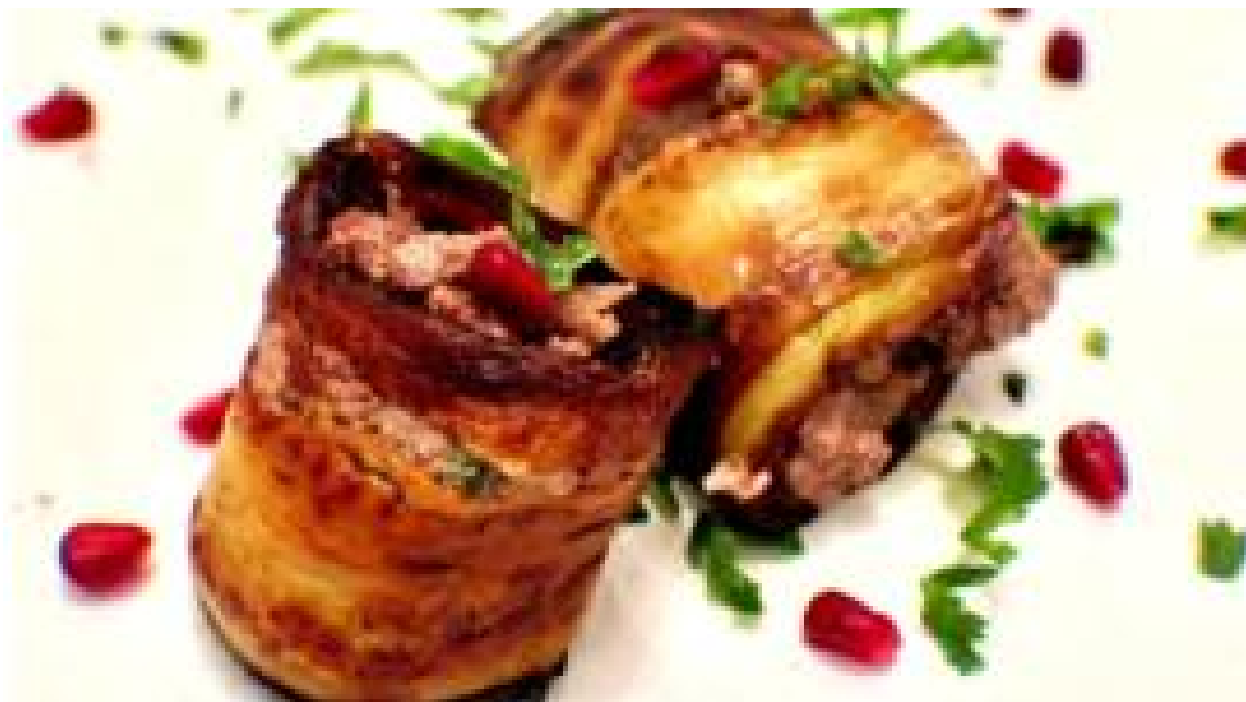
جام جهانی روسیه: غذای گرجستانی محبوب ذائقه ایرانیان