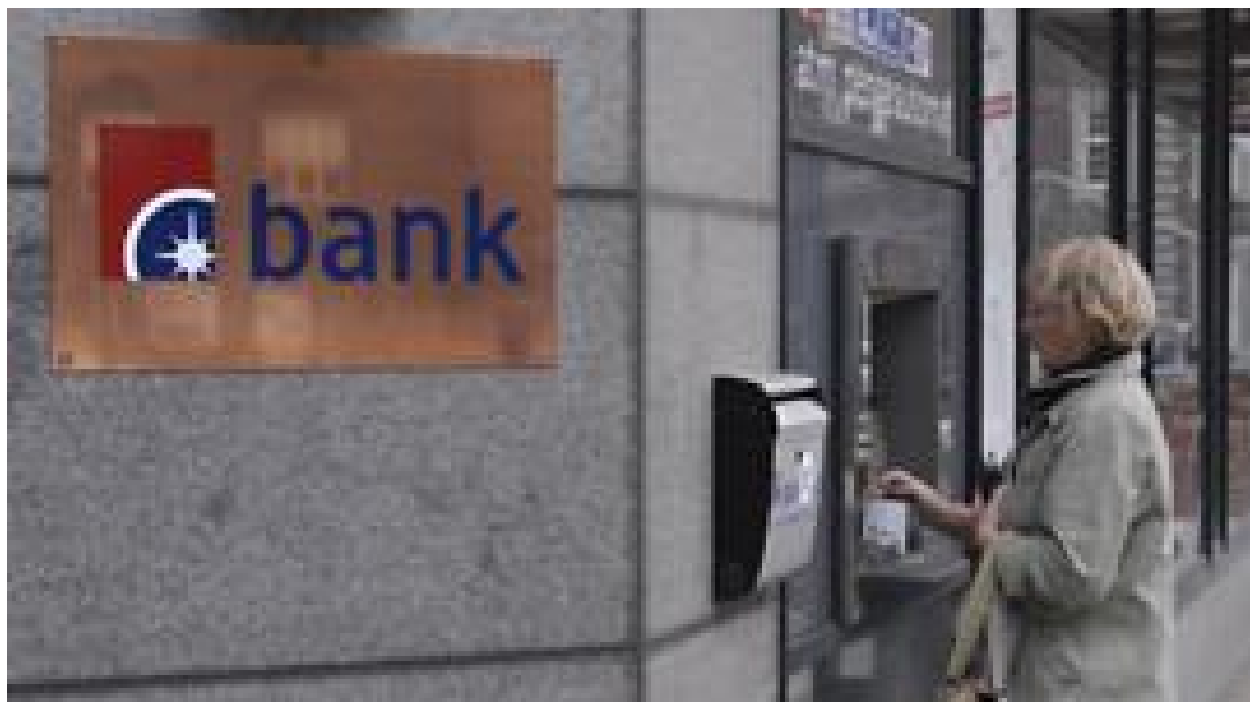
در چه کشورهایی زنان بیشتر از مردان حساب بانکی دارند؟