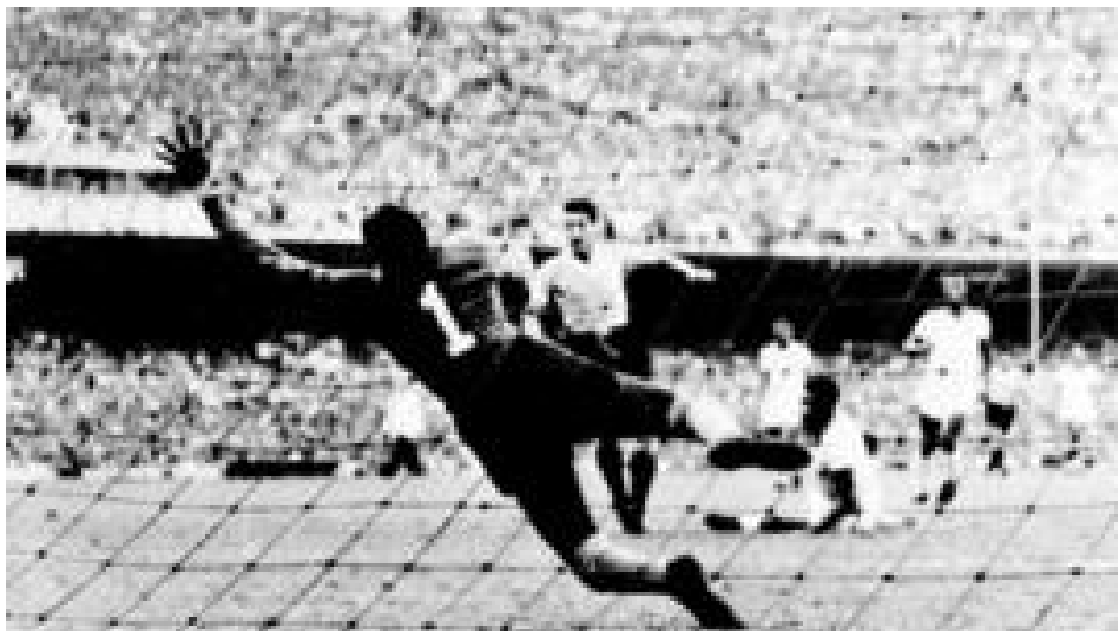
عجیب‌ترین اتفاقات جام جهانی: از مرده‌ای که گل زد تا داور مست