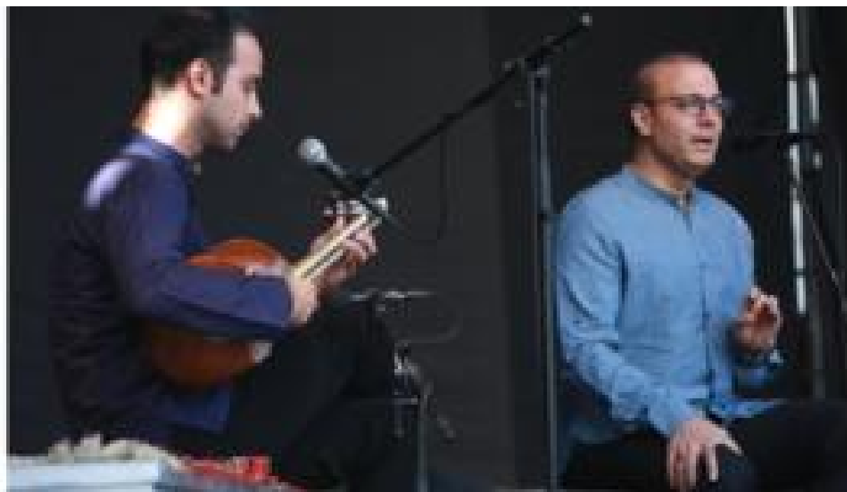
آوای علیرضا قربانی در دل پراگ