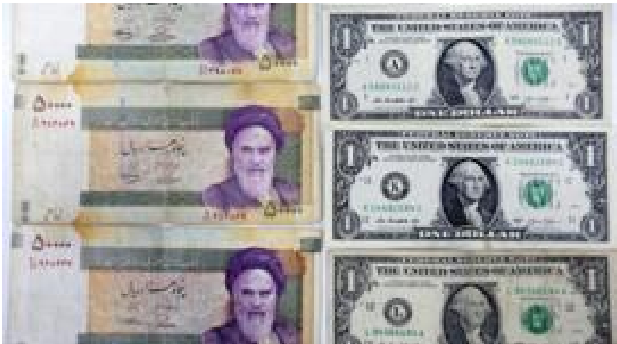
آیا با ورود 'ارز توافقی' بازار به آرامش می‌رسد؟