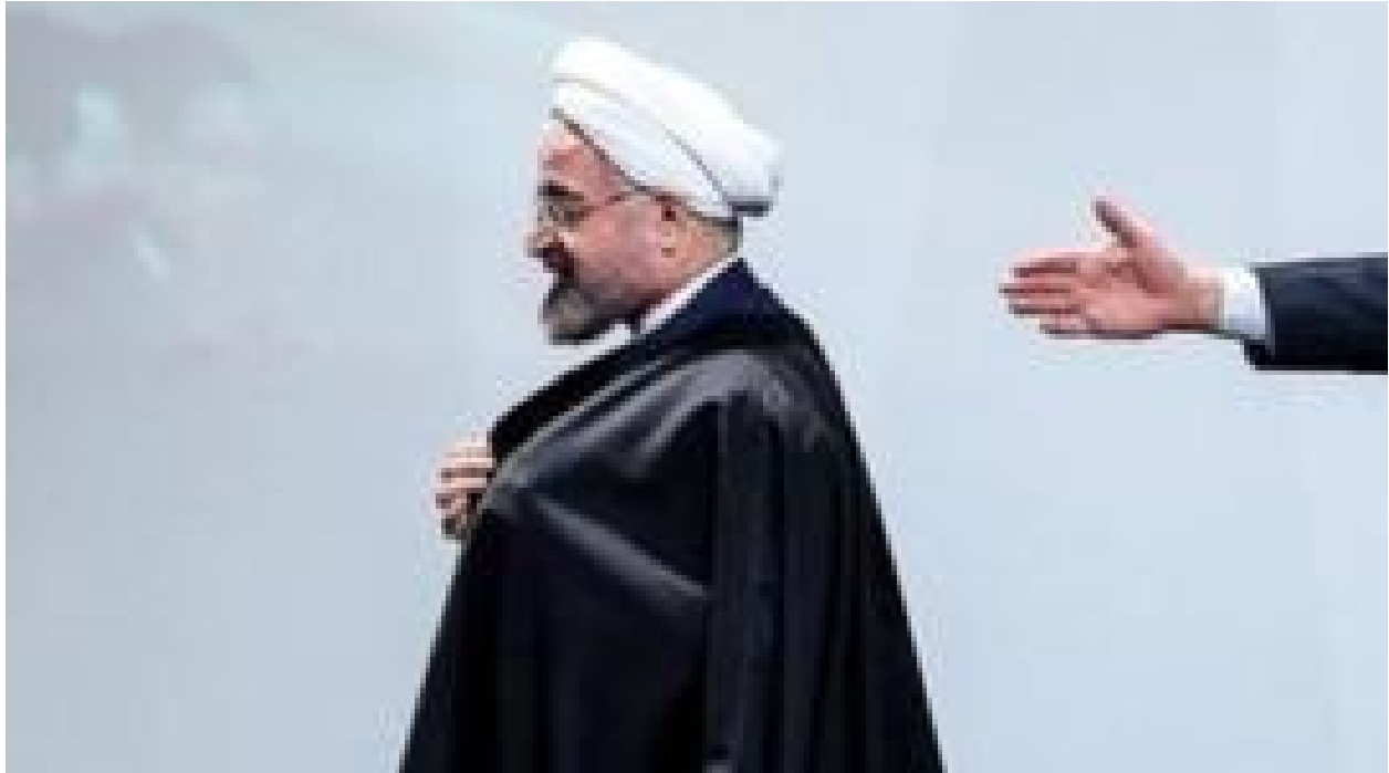
بحران فراگیر ایران؛ آیا روحانی قربانی خواهد شد؟