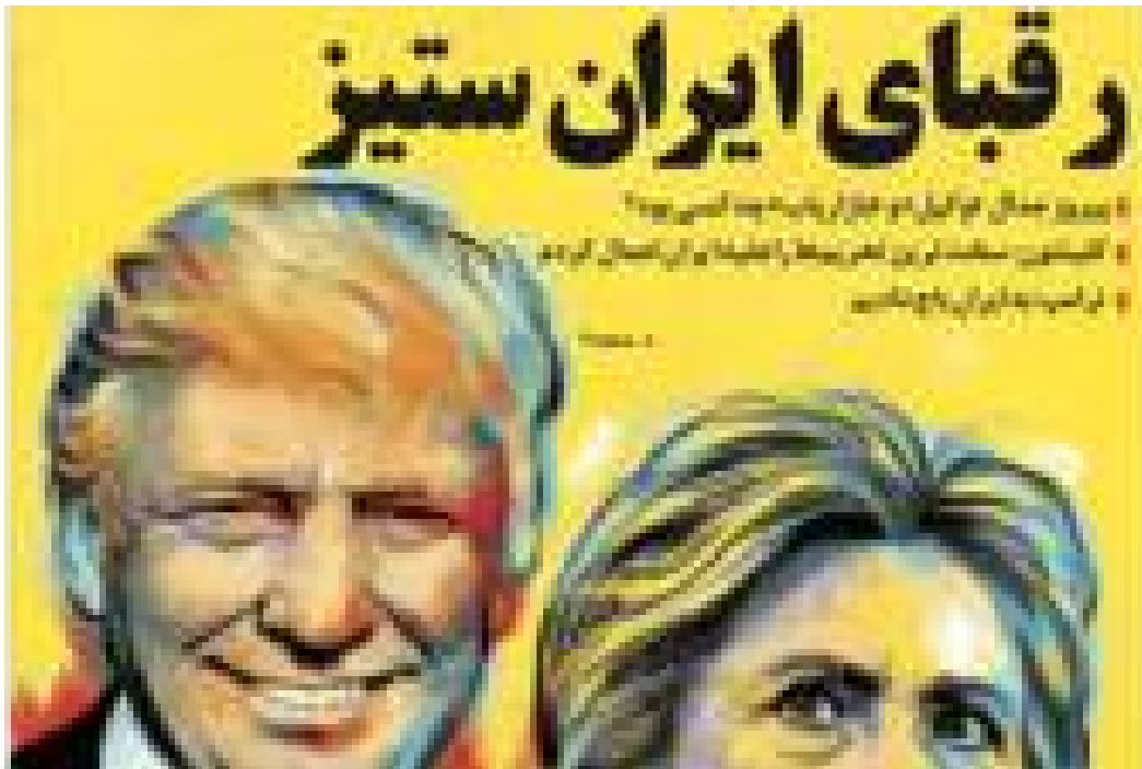
روزنامه‌های تهران، ایران در وسط دعوی ترامپ و کلینتون