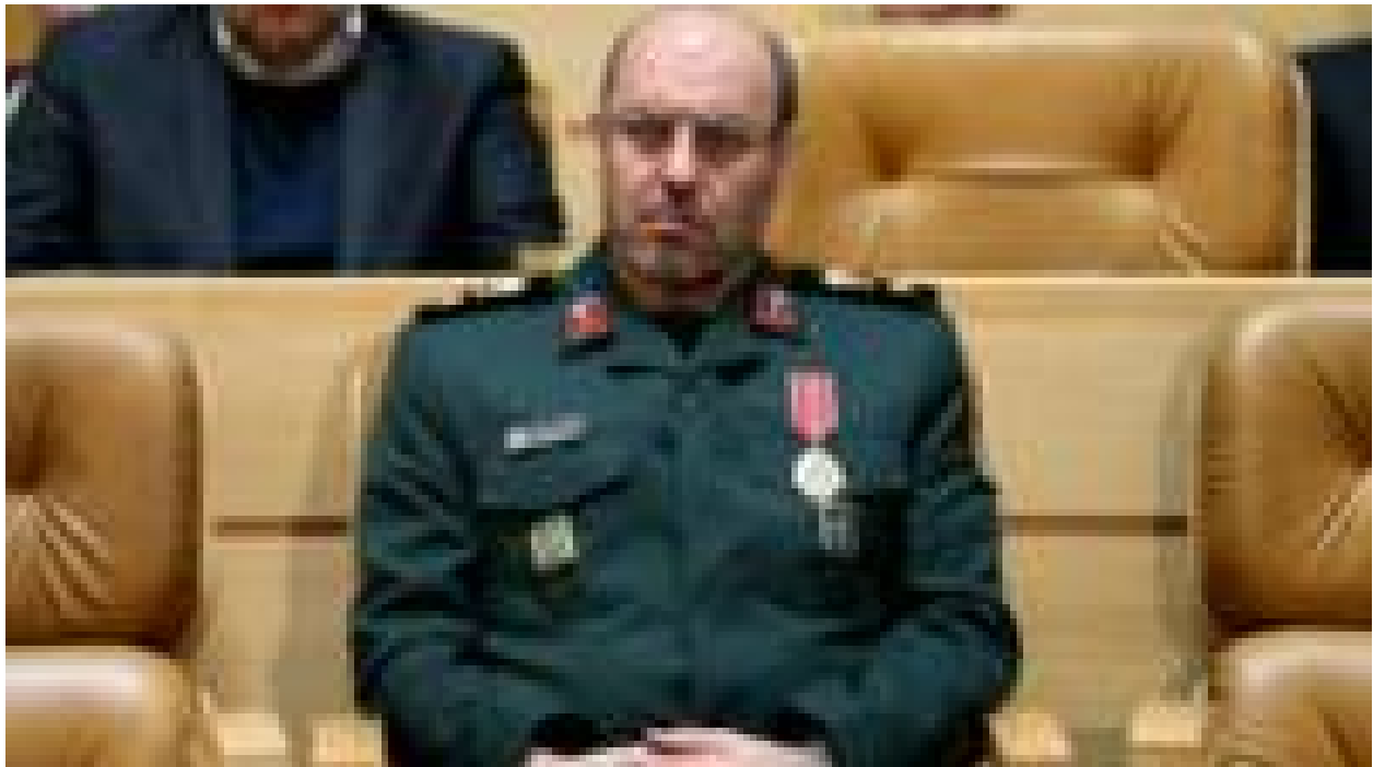
وزیر دفاع ایران بر توسعه توان موشکی تاکید کرد