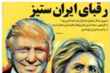
روزنامه‌های تهران، ایران در وسط دعوای ترامپ و کلینتون