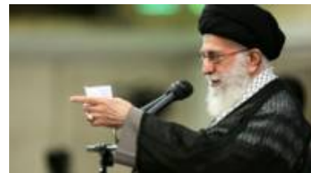
رهبر ایران تایید کرد که مخالف نامزدی احمدی‌نژاد در انتخابات است