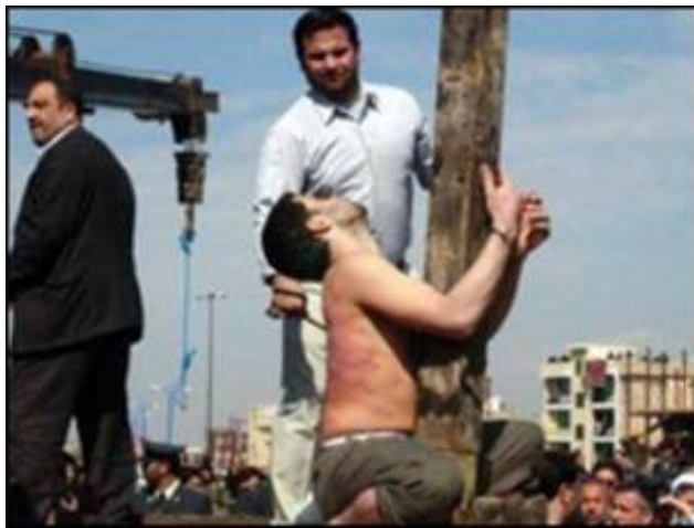
به گزارش عفو بین الملل سال گذشته بیش از 380 نفر در ایران اعدام شدند

کرده ش گروه‌ها پیدا کرد هلال ا است ک ندارد.