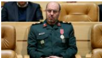
وزیر دفاع ایران بر توسعه توان موشکی تاکید کرد