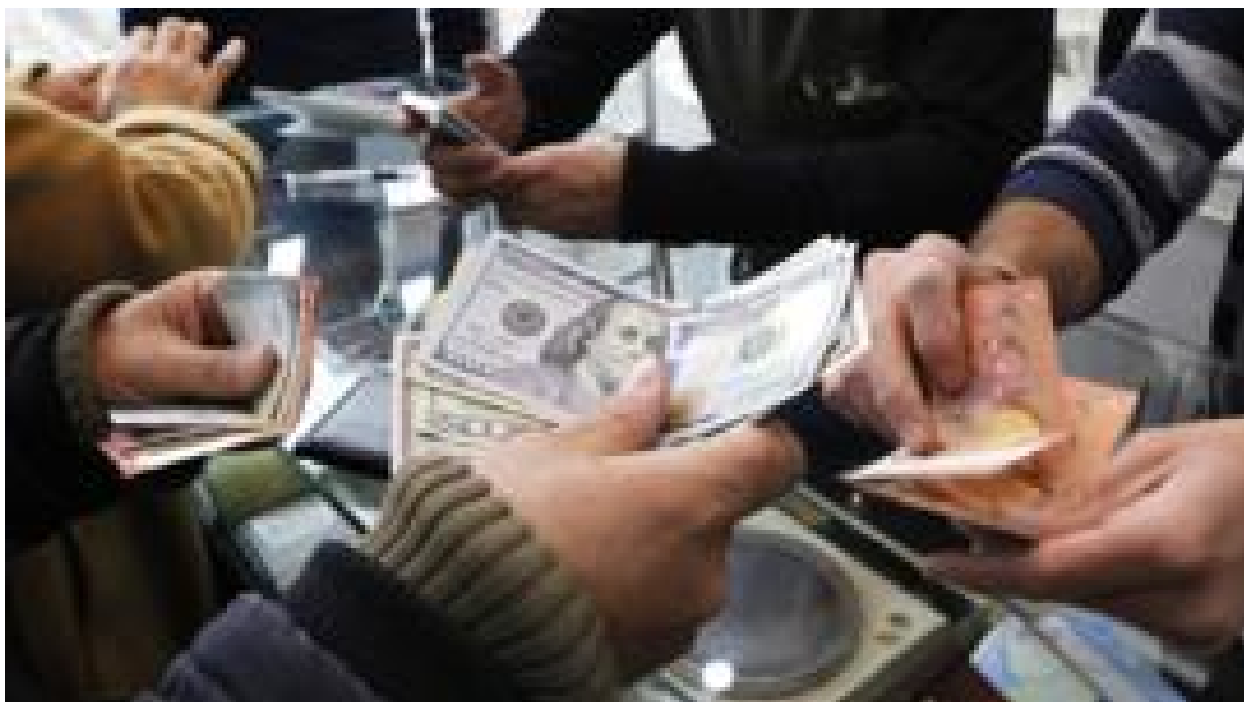
بالا رفتن قیمت دلار چگونه روی زندگی روزمره مردم تأثیر می‌گذارد

آمریکا بعد از سال ۱۳۴۲ چطور آیت‌الله خمینی را زیر نظر گرفت