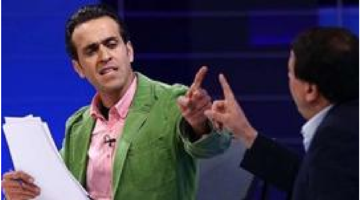
حرکت بدون توپ #علی_کریمی؛ 'قضاوت با مردم'