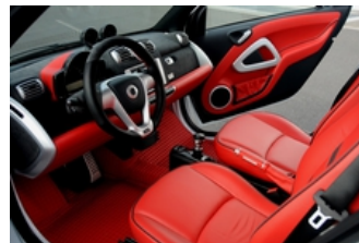
انواع لوازم تزئینی خودرو تا 10 درصد تخفیف

[مختص مدیران] لطفا نرم افزار جدید سازمانی نخرید !!!! سامانه ساز مبتنی بر فرآیند BPB