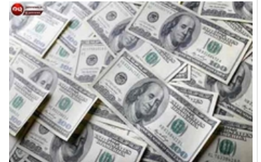
۲۱ دانستنی درباره میلیونرها که حتما باید بدانید