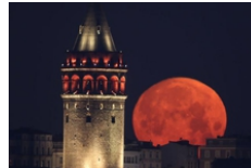
هتل های محبوب میدان تکسیم