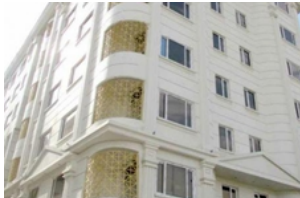
خرید آپارتمان با بهترین شرایط در تهران