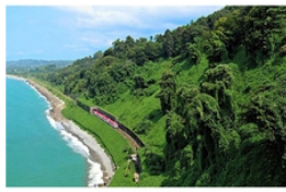
سفر به زیباترین شهر ساحلی قفقاز