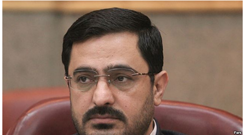
سعید مرتضوی؛ دادستان پیشین عمومی و انقلاب تهران