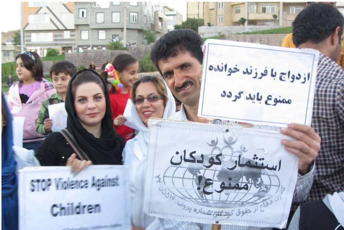
اعتراض به ماده ۲۷ قانون حمایت از کودکان و نوجوانان بی سرپرست و بد سرپرست، سنندج، مهر ۱۳۹۲

متن تبصره ماده ۲۷ که در متن اولیه لایحه حمایت از کودکان و نوجوانان بی سرپرست و بد سرپرست آمده بود به شرح زیر بود: